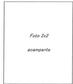
Foto 2x2 acampante